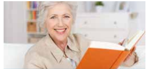
Endlich wieder: Lesen ohne Brille

Die „ bifokale “ Intraokularlinse verfügt nicht über einen, sondern über zwei Brennpunkte. Neben der Ferne wird zudem ein scharfes Sehen in der Nähe oder im Intermediärbereich ermöglicht. Die „ trifokale “ Intraokularlinse ermöglicht ein optimales Sehen in der Nähe, der Ferne sowie im Intermediärbereich. Unsere Augenspezialisten beraten Sie gern, um die optimale intraokulare Kunstlinse für Ihre individuellen Bedürfnisse zu bestimmen. Für eine ungetrübte Sicht und beste Sehverhältnisse!