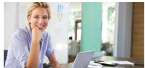
Entspannt im Alltag: Das Umfeld gut sehen