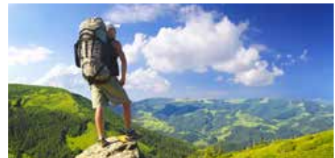
Ohne Sehhilfe unterwegs: Einfach beste Fernsicht