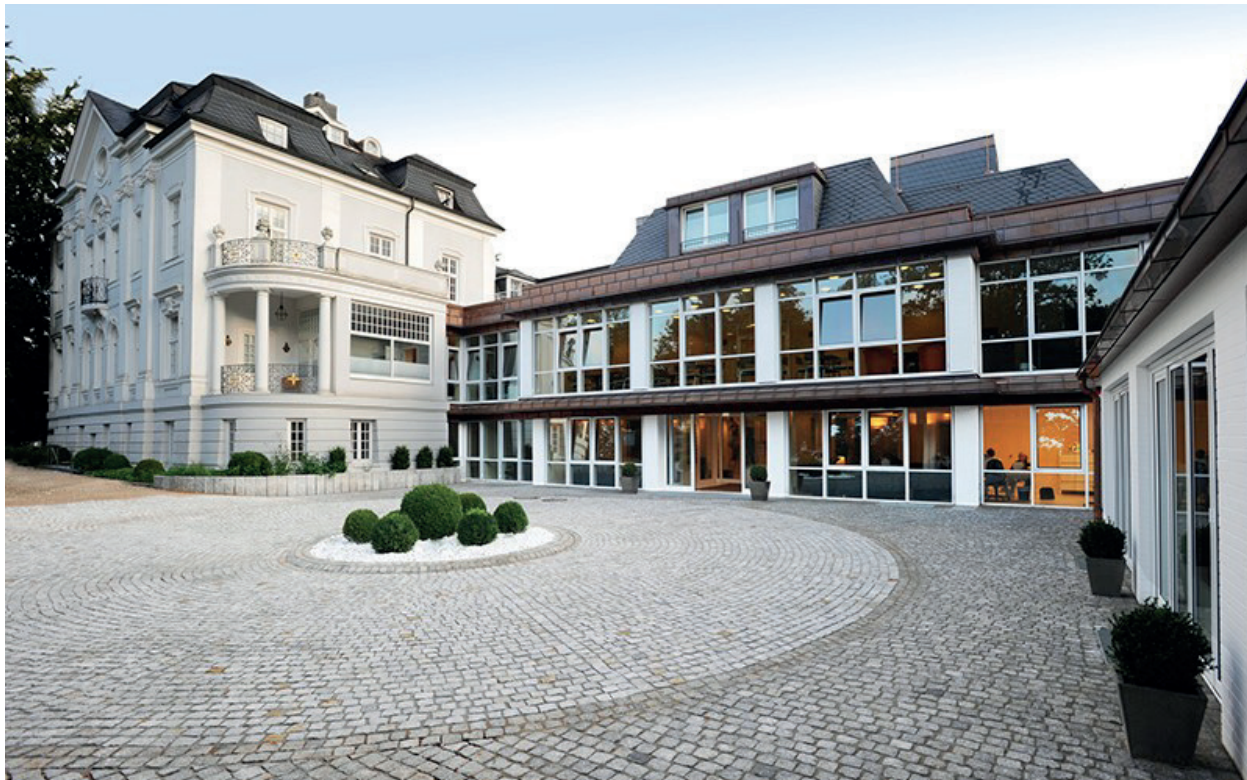
Ihre nordBLICK Augenklinik Bellevue